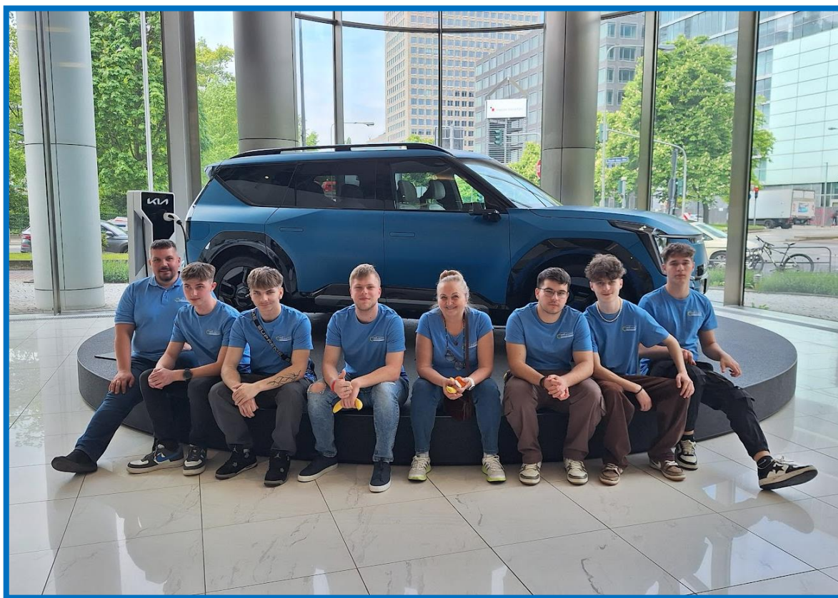
Obr. č. 1: Centrála Kia Europe - tréningové centrum