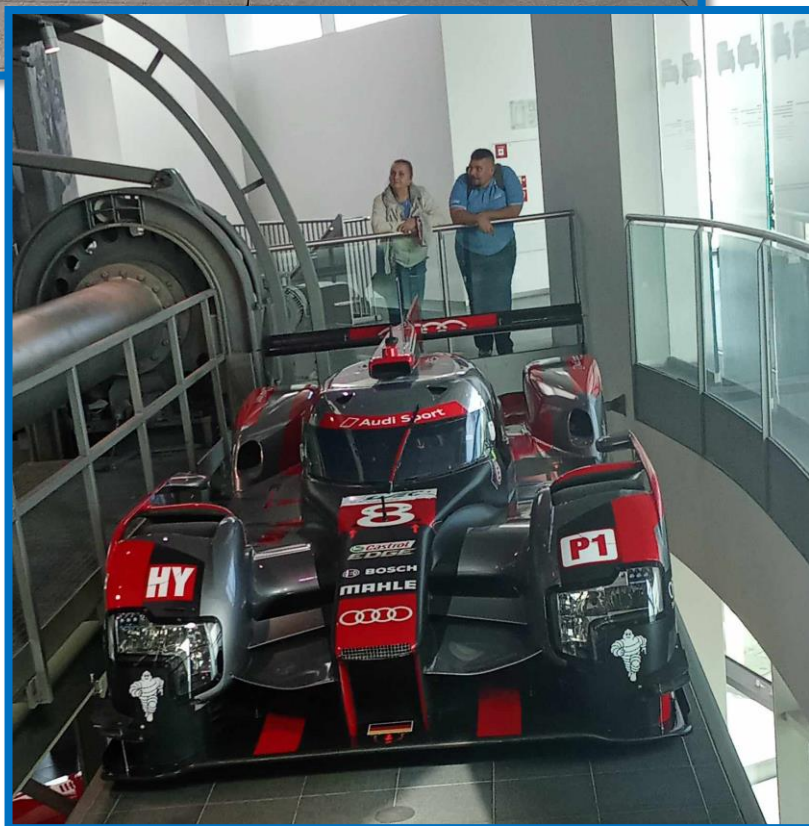
Obr. č. 3: AUDI MUSEUM