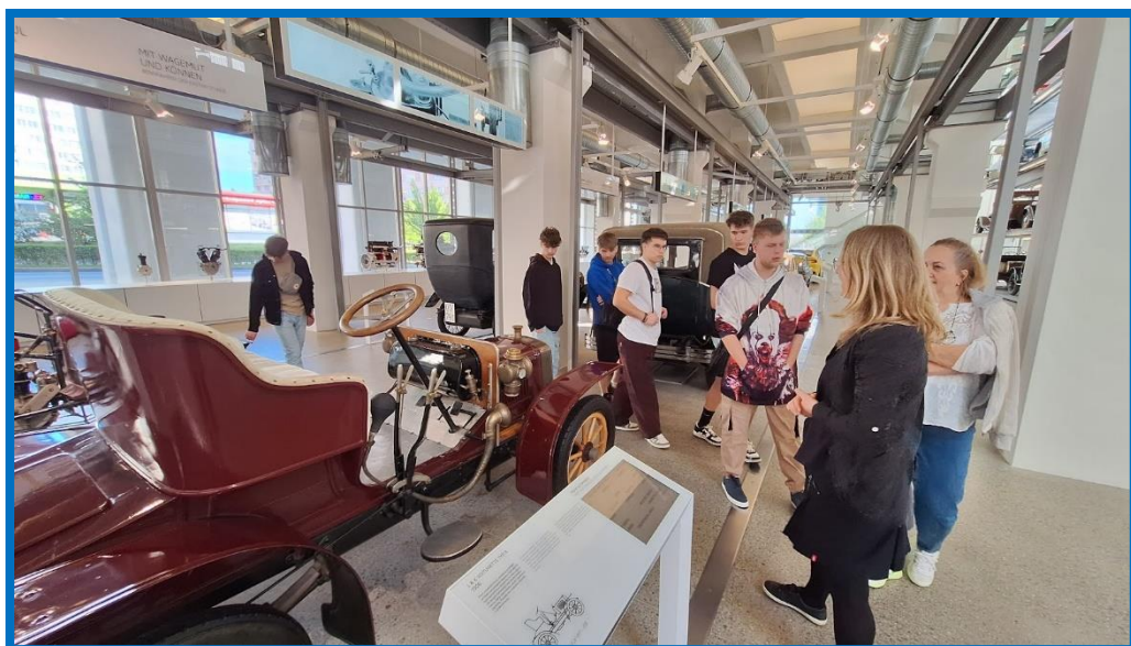
Obr. č. 8: ŠKODA MUSEUM