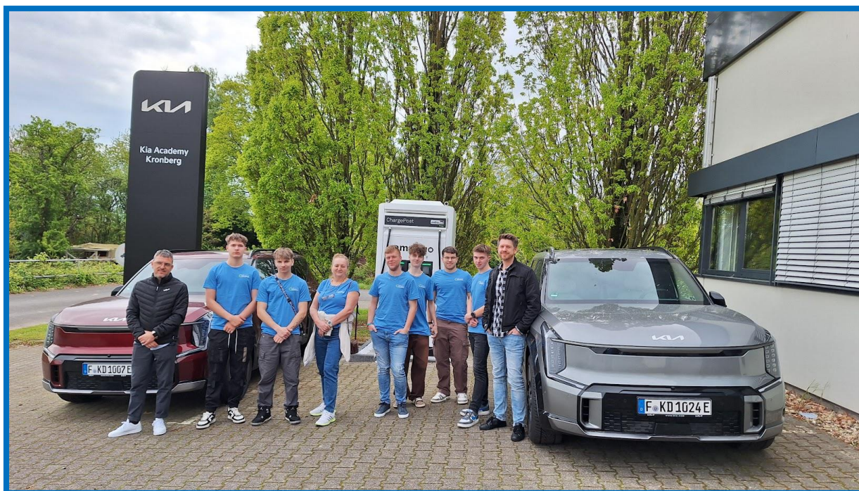
Obr. č. 2: Centrála Kia Europe - tréningové centrum