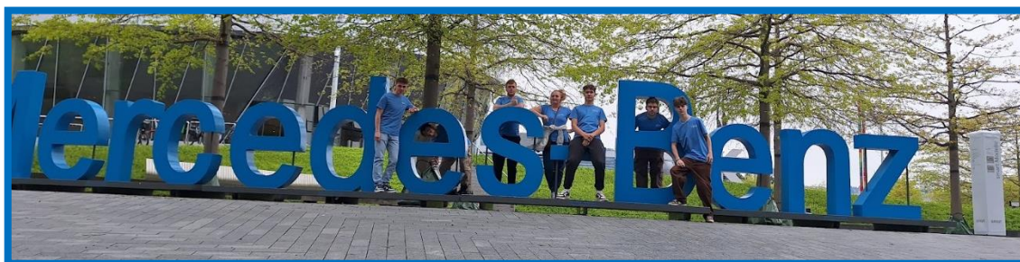
Obr. č. 4: MERCEDES BENZ MUSEUM