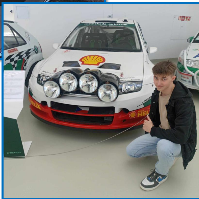
Obr. č. 9: Fotografie žiakov