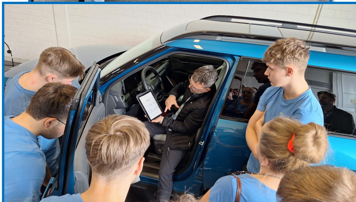
Obr. č. 6: Centrála Kia Europe - tréningové centrum