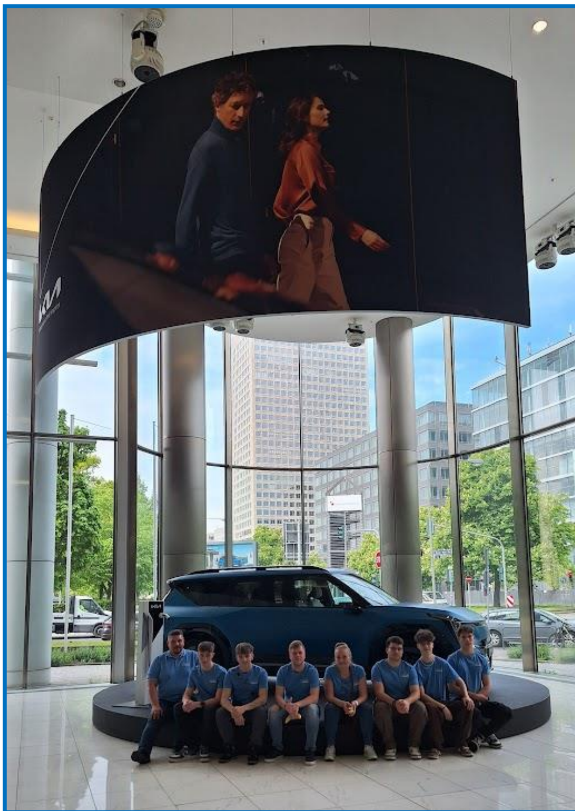
Obr. č. 10: Centrála Kia Europe