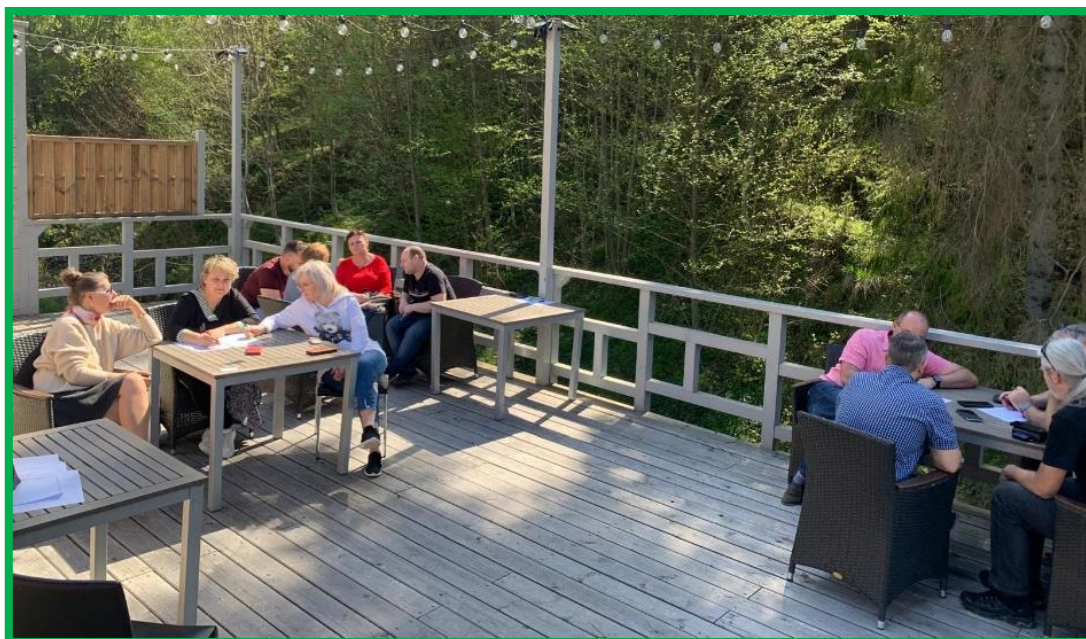
Obr. č. 8 - Aktivita – argumentácia v rámci kritického myslenia