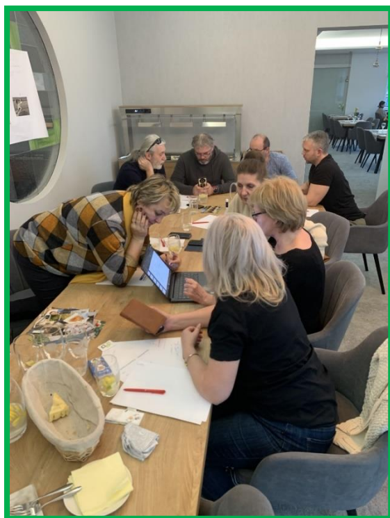
Obr. č. 12, 13 - Tvorba prezentácií v rámci komunikačných zručností