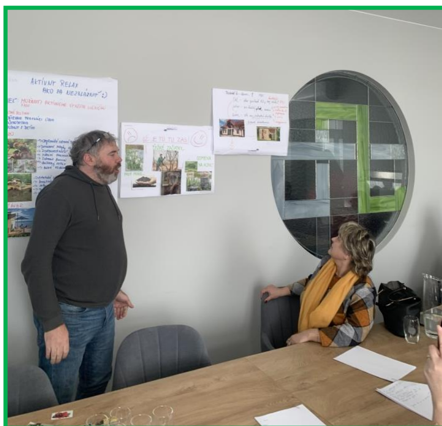
Obr. č. 5 – Prezentácia soft skills tém