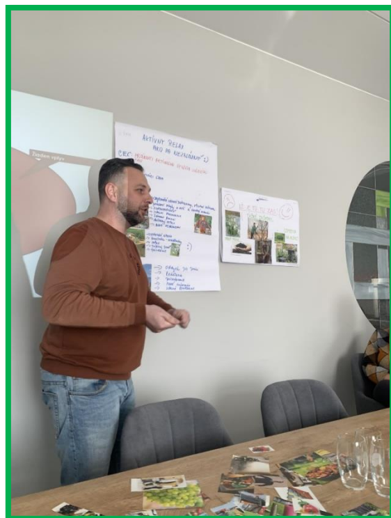
Obr. č. 10, 11 - Prezentácia soft skills tém