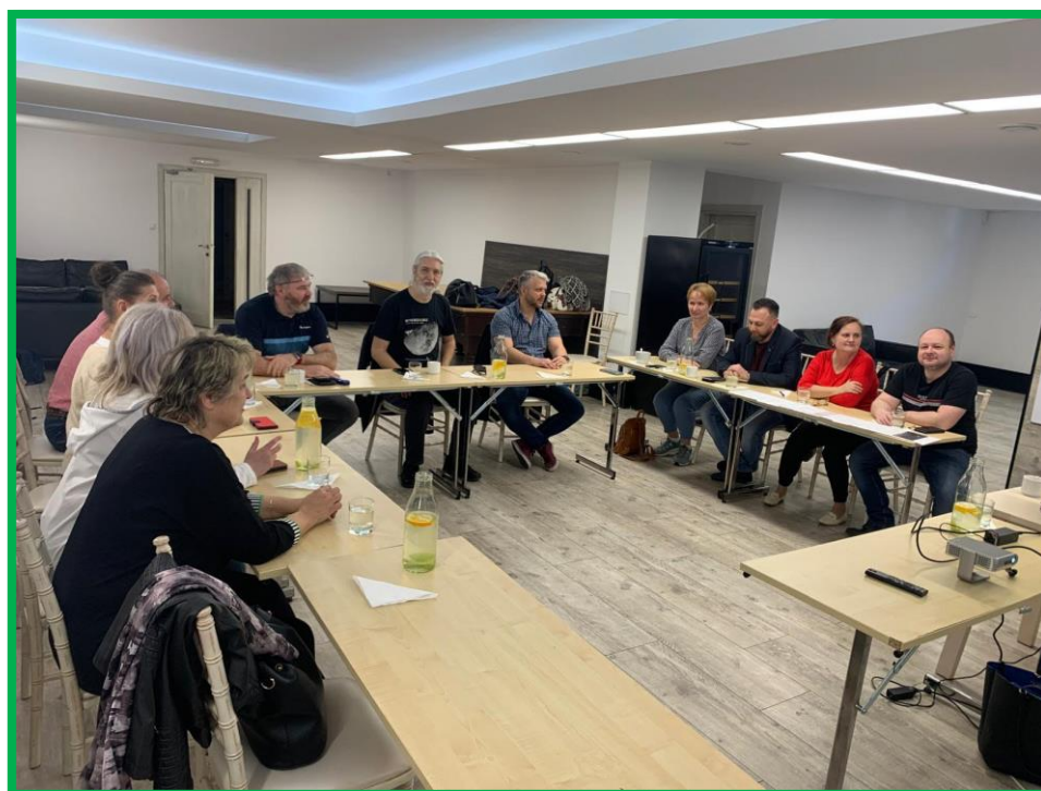
Obr. č. 3 – Aktivita - sebahodnotenie