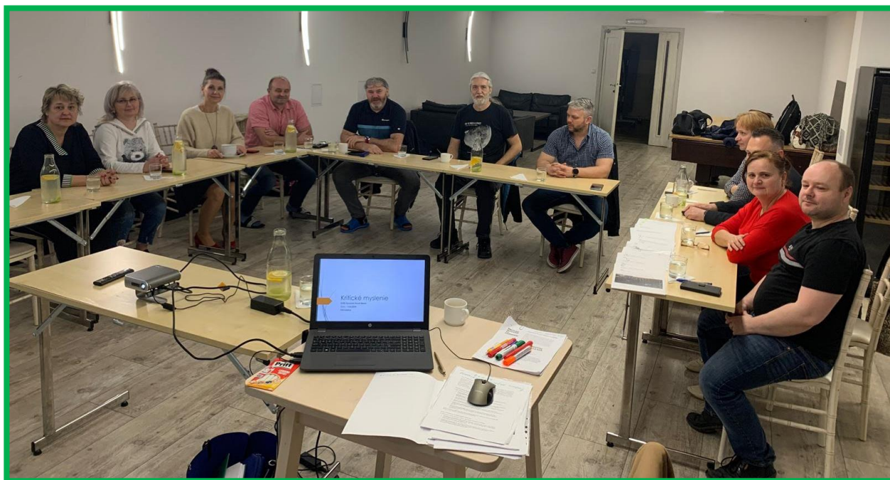
Obr. č. 4 – Workshop k sebapoznávaniu