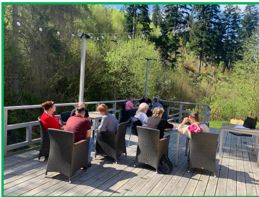
Obr. č. 7 – Aktivita – argumentácia v rámci kritického myslenia