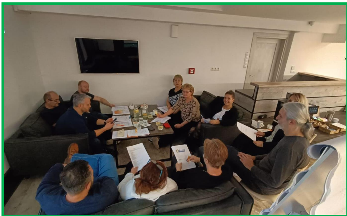
Obr. č. 2 – Komunikačné aktivity