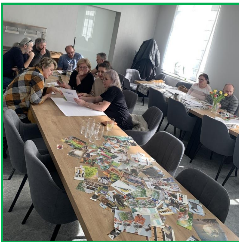
Obr. č. 9 – Tvorba prezentácií v rámci komunikačných zručností