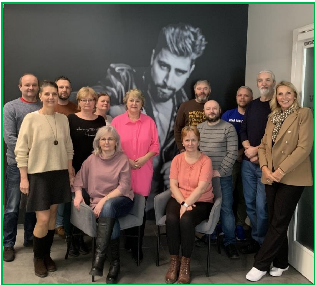
Obr. č. 14 – Účastníci soft skills + lektorka